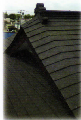
ディプロマツスターの箕甲部